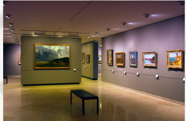
Exercices de médiation directe au musée des Beaux-arts