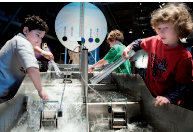
Cet outil pédagogique démontrant les principes des barrages hydrauliques est intégré à l'exposition Science 26 au Centre des sciences de Montréal

Après avoir rappelé quelques principes de base concernant la place des publics dans les musées et la fonction éducative de ces derniers, l'auteur envisage les différents aspects de la conception des outils pédagogiques, montrant d'une part que cette démarche ne se conçoit pas sans un mode d'évaluation des outils en question et d'autre part que dans ce domaine l'évaluation dite formative s'impose.