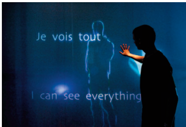
Exposition Imagine ! au Centre des sciences de Montréal

et de cerner les difficultés – les obstacles pédagogiques – que l'apprenant affrontera et d'imaginer des modes de remédiation pédagogique adéquats (Bloom, 1969) (6).