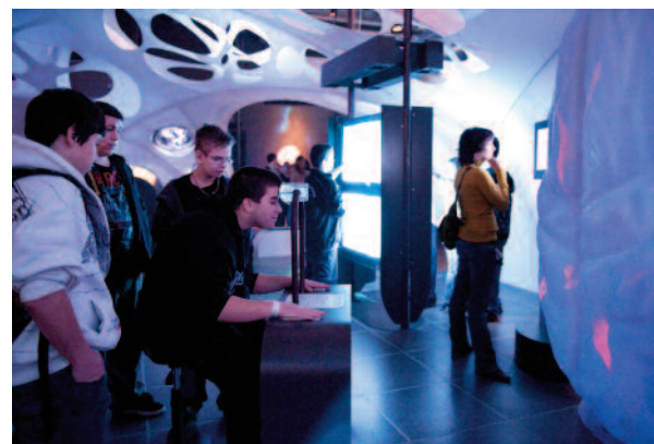
Des visiteurs expérimentent différents outils pédagogiques dans l'exposition Imagine !

Le concepteur d'un outil pédagogique devra, non seulement identifier les caractéristiques de l'activité proposée à l'apprenant mais aussi celle du type d'apprentissage sous jacent. On peut favoriser la découverte active en proposant de toucher des empreintes et des moulages, manipuler des objets, regarder et se poser des questions, faire des liens entre la ressemblance des spécimens afin de constituer des indices de parenté entre espèces et introduire le principe de classification biologique. Ainsi, l'activité proposera aux visiteurs d'observer ce qui lui est présenté, de