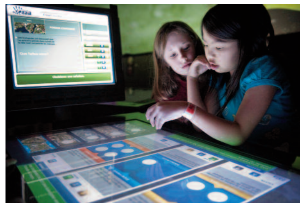
Dans le cadre du jeu interactif Mission Gaïa , présenté au Centre des sciences de Montréal, ces enfants réfléchissent à la solution à privilégier, suite à une catastrophe écologique ayant entraîné une contamination au mercure de poissons.

Plusieurs musées conçoivent et réalisent des guides de visite qui poursuivent des objectifs pédagogiques affirmés et favorisent une démarche éducative qui facilite