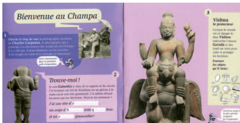
Le graphisme est un élément de séduction.

L'enfant est plus à même d'utiliser, de lire et de garder un document d'accompagnement à la visite plaisant à feuilletter. C'est pourquoi le concepteur doit porter une attention particulière au graphisme, aux illustrations, à la mise en forme du livret. Varier les polices de caractères et les couleurs peut également rendre la lecture plus agréable, à condition de le faire en quantité raisonnable faute de quoi, on risque de rendre le document illisible. Ces outils vont permettre de hiérarchiser le contenu du livret afin que l'enfant se repère plus facilement. Il est bien d'intégrer également des illustrations, que ce soit des photographies ou des dessins. Toutefois proposer des jeux qui puissent être réalisés uniquement à l'aide de ces illustrations risque de détourner l'enfant de l'exposition : il se servira de la reproduction pour répondre aux questions, sans regarder l'objet.