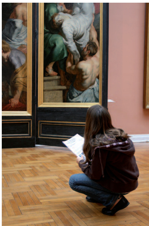
De nombreux livrets guident l'observation.

une enquête dont elles expliquent le déroulement. Le personnage-guide doit être en rapport avec l'exposition, donne des consignes à l'enfant sur ses déplacements par exemple, guide le regard et les déplacements de l'enfant, lui donne les consignes pour réaliser les différentes activités et l'informe sur l'exposition en s'adressant à lui comme à un ami.