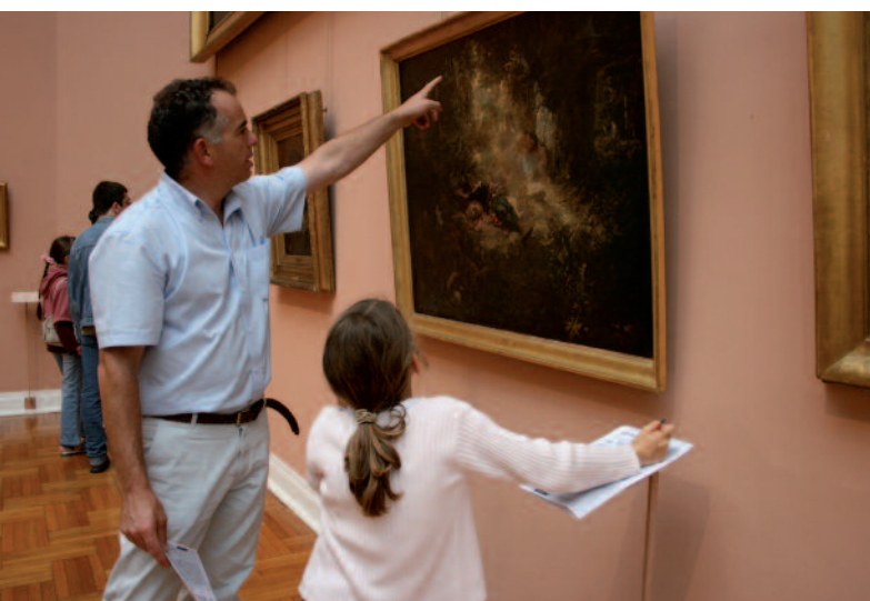
Le livret pour enfants : un support pour partager la visite

Les auteurs proposent une réflexion sur la conception et l'utilité des documents d'accompagnement à la visite pour les enfants dans les institutions muséales, montrant notamment que ces outils ne doivent pas être une fin en soi mais plutôt mis au service d'objectifs bien définis : séduire l'enfant, lui permettre de s'approprier le musée ou l'exposition tout en lui formant le regard et le jugement.